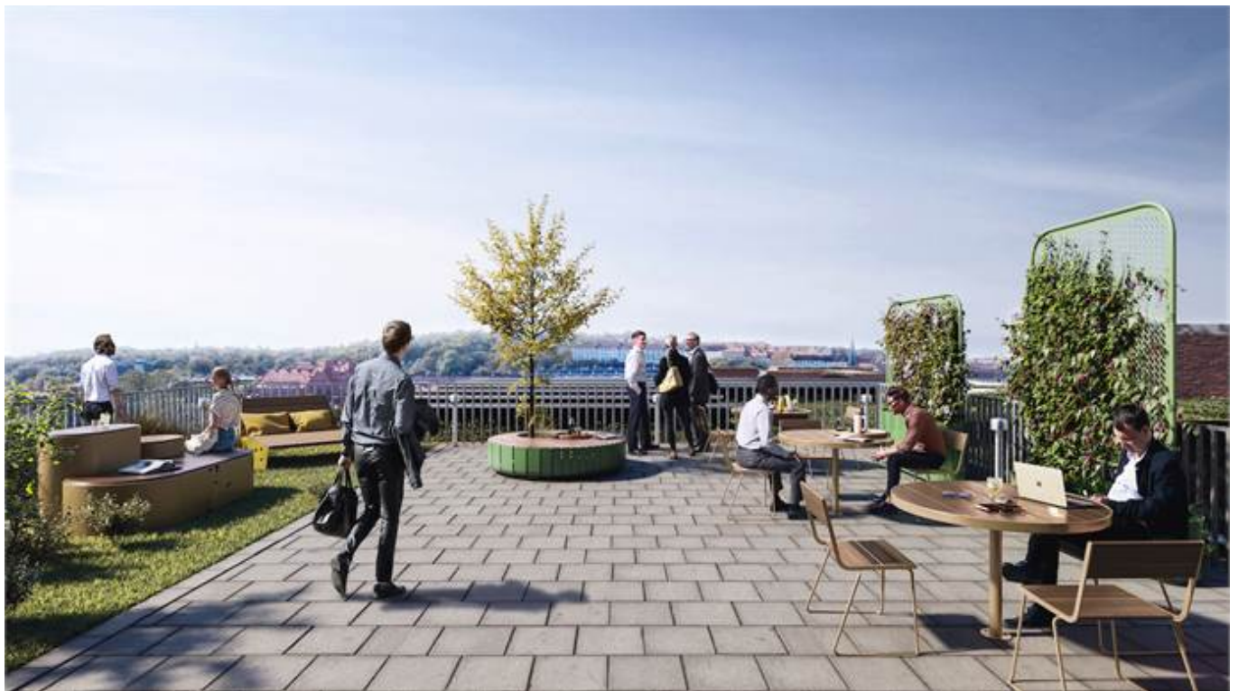
Hvitfeldtsplatsen 5, Inom Vallgraven, City, CBD, Göteborg - Kontor