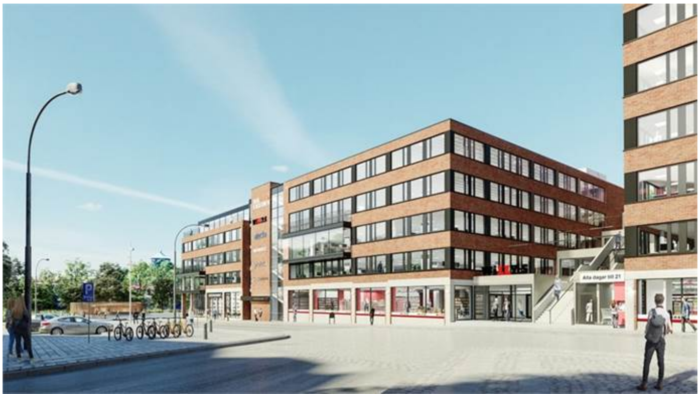
Hvitfeldtsplatsen 5, Inom Vallgraven, City, CBD, Göteborg - Kontor