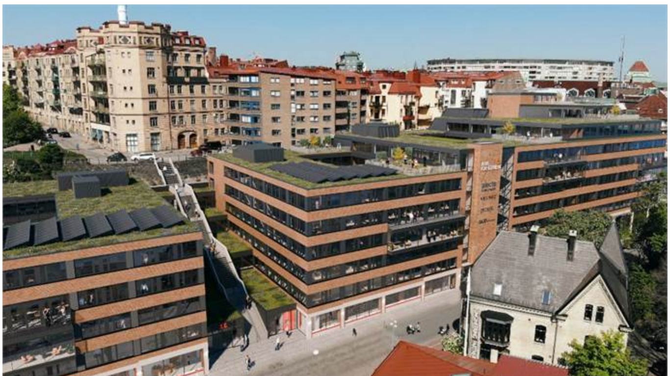
Hvitfeldtsplatsen 5, Inom Vallgraven, City, CBD, Göteborg - Kontor