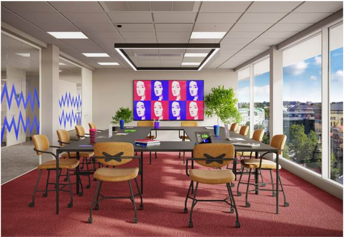
Hvitfeldtsplatsen 5, Inom Vallgraven, City, CBD, Göteborg - Kontor