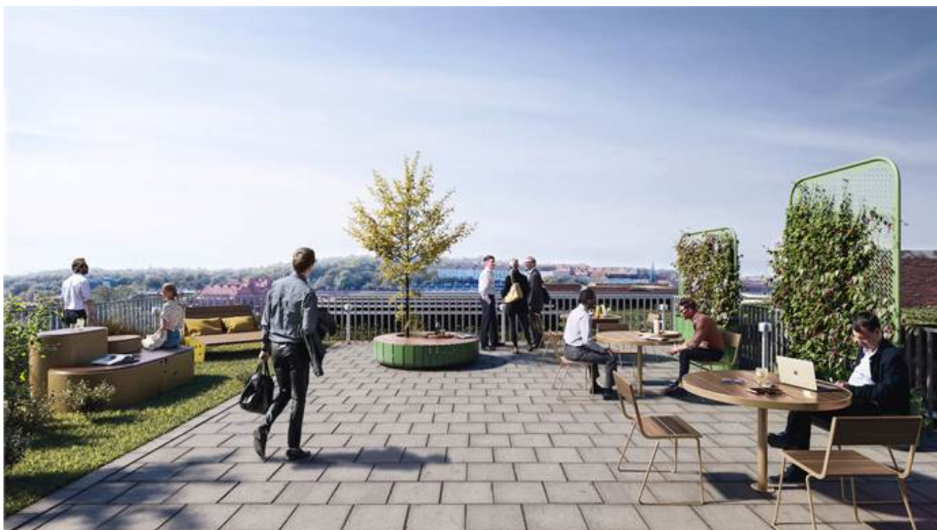
Hvitfeldtsplatsen 5, Inom Vallgraven, City, CBD, Göteborg - Kontor