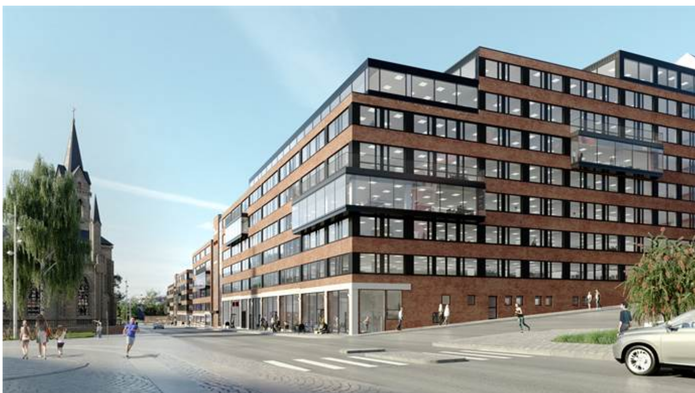
Hvitfeldtsplatsen 5, Inom Vallgraven, City, CBD, Göteborg - Kontor