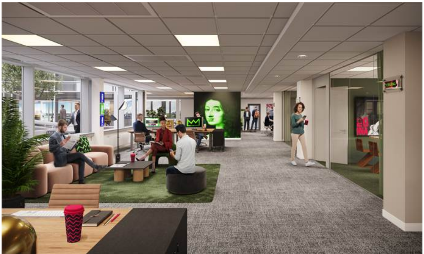
Hvitfeldtsplatsen 1, Inom Vallgraven, City, CBD, Göteborg - Kontor