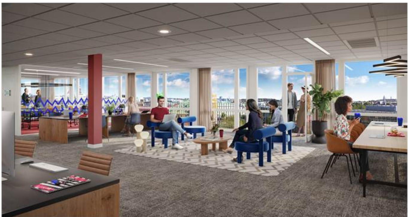
Hvitfeldtsplatsen 1, Inom Vallgraven, City, CBD, Göteborg - Kontor