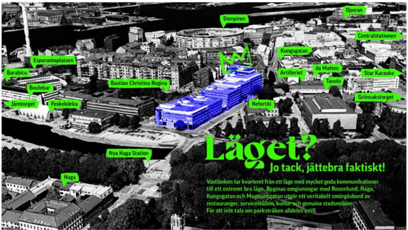
Läget? - Jo tack, jättebra faktiskt